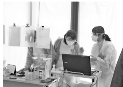
玄関で外来患者の対応をする看護師