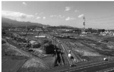
造成工事の様子◇小田原厚木道路付近から平成28(2016)年3月に撮影

*産業用地面積は約15.9haの全18区画。公共施設として区画道路や公園1カ所、調整池2カ所などが整備されています