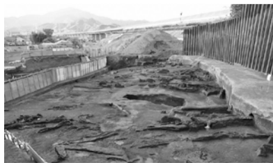
西岡岡・向畑遺跡の埋没林(縄文時代)

今年度発掘された遺跡の内容をスライド写真で報告 ☎3月12日(土)午前10時~正午 ☎中央公民館 ☎50人(申込順) ☎3月4日(金)