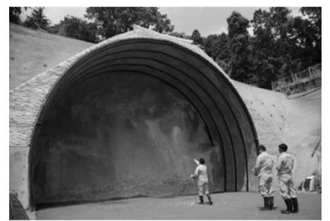
本格的な掘削工事が始まる前、平成29(2017)年6月の高取山トンネル