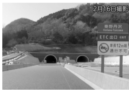
伊勢原大山ICから秦野側に向かう高取山トンネルの出入口