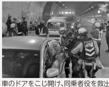
車のドアをこじ開け、同乗者役を救出