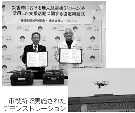
市役所で実施されたデモンストレーション