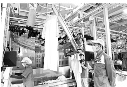
工場内には約100人のラインメンバーが従事