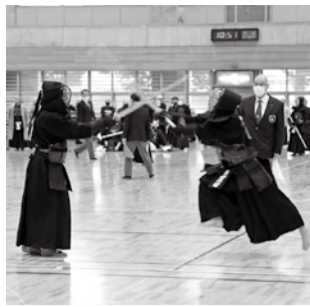
前回のかながわシニアスポーツフェスタ剣道大会

11月12日～14日のねりんピックかながわ2022剣道交流大会に向けたリハーサル大会を開催。県内から59歳以上の剣士が団体戦と個人戦で競い合います。 とき 5月28日(土)午前10時～午後4時 ところ 市体育館