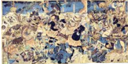
歌川芳虎「栗津が原ノ合戦」安政元(1854)年