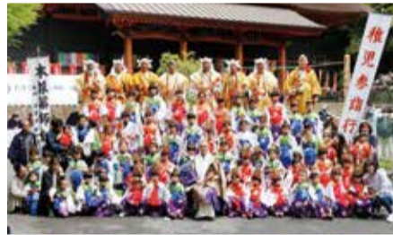
約60人の子どもたちが稚児行列に参加