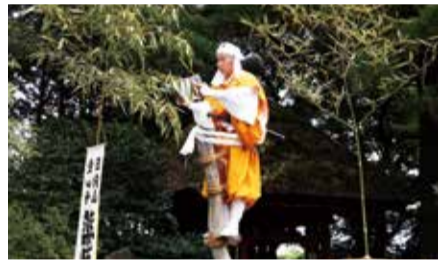
シイの木の上で口上を読み上げます