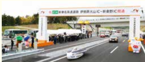
ソーラーカーや電気自動車も新しい道路を走行