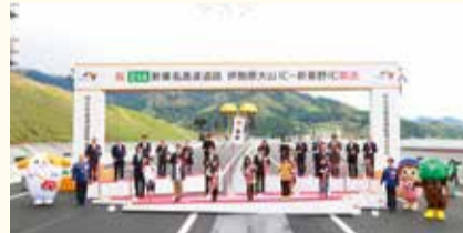
市内の小・中学生やフルリンも参加

その後、本線道路上では、鉄入れやくす玉開披(写真左)、通り初め(写真右)が行われ、特別な一日を盛り上げました。