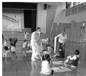
サポーター活動の様子

特別な資格は不要です。子どもが好きな人、熱意と責任感をもって取り組んでいただける人なら大歓迎です。地域住民がスタッフとして参画することで、子どもと大人の交流が図られ、コミュニティの活性化も期待されます。