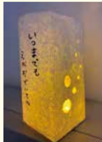
オリジナルとうろうを作ってみませんか