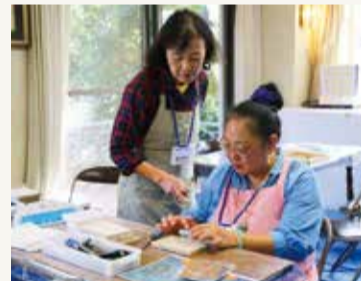
スタッフが作り方を丁寧に説明