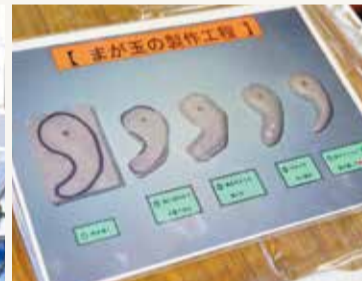
まが玉の製作工程