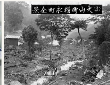
震災発生時の大山町・福永町の様子