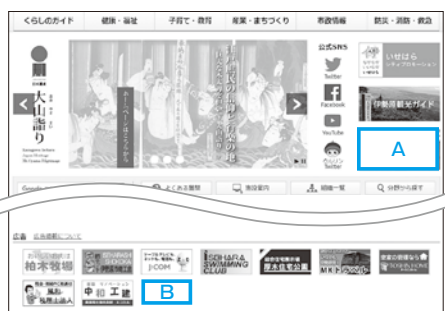
広告掲載イメージ

申し込みください。申込書は市ホームページ「申請書ダウンロード」から入手できます◇随時受け付けています