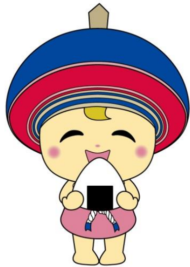
伊勢原市公式イメージキャラクター クルリン

伊勢原市食育ホームページでは、「公立保育所・小学校の給食献立」、「簡単料理レシピの紹介」、「食育掲示板」、「伊勢原市の食育事業」など、食育情報を紹介しています。ぜひご利用ください。