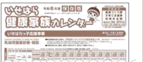
タブロイド判(273mm×406mm)、全4ページ

乳幼児健診・各種検(検)診の日程や健康づくり事業の案内などを掲載した「令和6年度 いせはら健康家族カレンダー」を作成しました。3月26日(火)に新聞折り込みで配布するほか、市役所、各公民館などの公共施設でも配布します。*同日以降、市ホームページ「健康・福祉」→「がん検診」からもご覧いただけます。 健康づくり課 94-4609