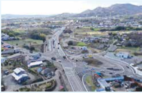
分れ道交差点◇2月26日撮影

県道603号(西富岡バイパス)は、「新東名高速道路」および事業中の「厚木秦野道路」へアクセスする道路で全整備区間1.9kmのうち、日向薬師入口交差点から分れ道交差点までの約0.7kmが3月25日に開通し、全線での利用が開始されました。全線開通により、伊勢原大山インターチェンジへのアクセス向上や都市間の連携強化が促進され、新たな交通や物流の効率化が期待されるほか、災害発生時には緊急輸送道路として、救急・応急活動の円滑化が図られます。