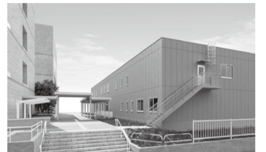
▶構造:鉄骨造地上2階建、延床面積:約1100㎡

また、キッズスペースや、落ち着いて話することができる相談スペースなどを設け、子どもが健やかに成長できるように、子育て支援の拠点として整備していきます。