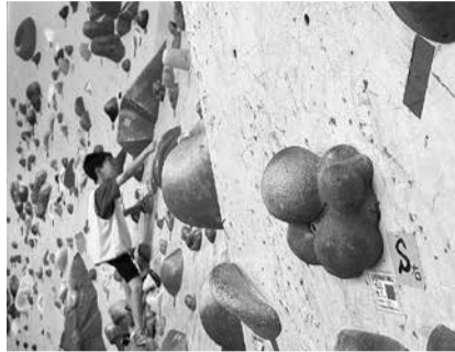
スポーツクライミング