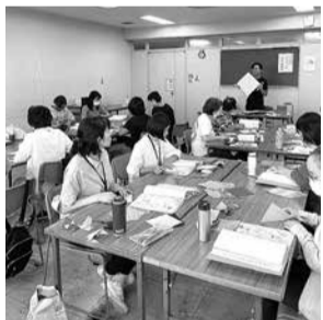
保育の知識を学びます