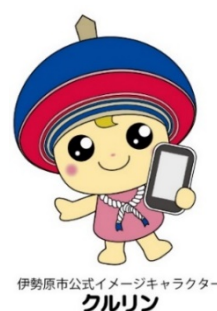
伊勢原市公式イメージキャラクター クルリン

〒259-1188 伊勢原市田中 348 番地 電 話：0463-94-4873 FAX：0463-93-5575