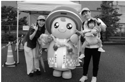
クルリングリーディング