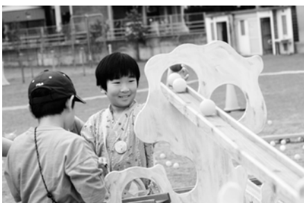
どうかんキッズランド