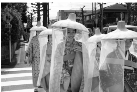
北条政子日向薬師参詣行列