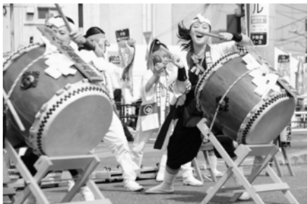
ハヶ岳泉龍太鼓演奏