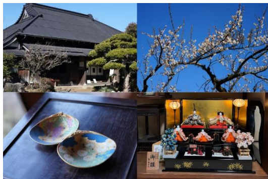
山口家住宅の外観（左上）、梅園の様子（右上） 貝合わせの貝殻（左下）、ひな人形（右下）

取材にお越しいただける場合は、 【2月9日（月）午後5時】 までに広報戦略課（0463-94-4864）へご連絡ください。