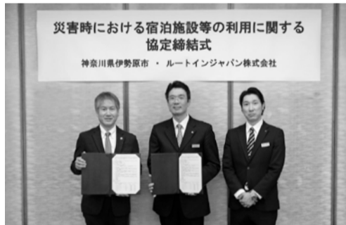
萩原市長(左)ルートインジャパン(株)北村関東地域総支配人(中央)中山神奈川地区 地区支配人(右)

2月13日、市とルートインジャパン(株)は、災害時に妊産婦や乳児などの要配慮者支援や被災者の応急仮設住宅などとして同ホテルを使用するための協定を締結しました。ホテルは、市からの要請に応じて客室や浴室などの施設提供のほか、応援自治体職員等の宿泊施設としても利用できます。