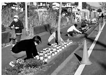
環境美化活動の様子

本市では、誰もが住みよい環境を作るため、地域住民により自主的に自治会が組織されています。話し合いや助け合いで、個人や家庭だけではできない問題の解決や、災害など非常時の対応に備えます。