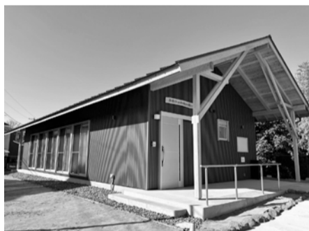
高森台ふれあい館

宝くじの社会貢献広報事業で、宝くじの受託事業収入を一部財源とし、高森台ふれあい館(高森台2-1-76)を建設しました。地域住民のコミュニティ活動拠点として活用されます。