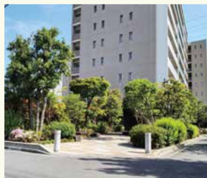
目にとまりやすい街角に植栽し季節感を演出しています

良好な景観形成には、長い時間と小さな取り組みの積み重ねが必要です。庭先や建物の色彩など、一人一人の気遣いが心地良いまちなみをつくります。身近な場所から景観づくりに取り組み、笑顔で暮らせる魅力的なまちを未来へつなごう。