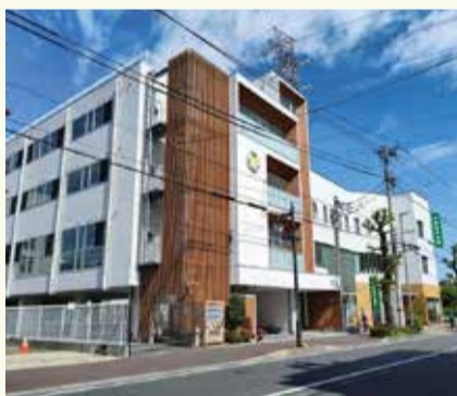
壁のデザインに変化をつけることで圧迫感が軽減されます