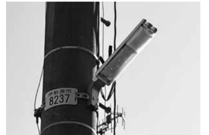
設置された防犯灯