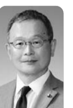
自治会の加入率低下と役員となり手不足について