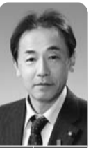
屋内退避における家庭備蓄や換気、要配慮者対策