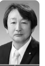
日向薬師・大山寺等の文化財の保護と防災について