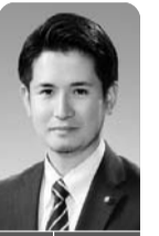
学校給食の地産地消の数値目標を問う