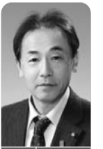
屋内退避における家庭備蓄や換気、要配慮者対策