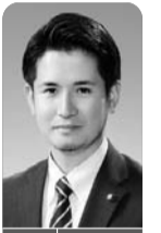
学校給食の地産地消の数値目標を問う