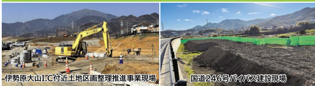
伊勢原大山I.C.付近土地区画整理推進事業現場