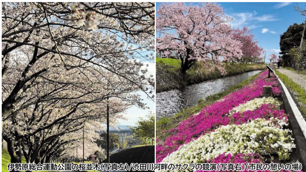
伊勢原総合運動公園の桜並木(写真左)/浅田川河畔のサクラの競演(写真右)(市民の憩いの場)

議員から提出された「中東情勢の早期收拾と国際社会の安定に向けた取組及び市民生活への影響緩和を求める意見書について」は賛成全員で原案のとおり可決しました。一般質問は、3日間行われ、15人の議員が市政に対する考え方などについて執行機関に説明を求めました。(4面・5面に一般質問)