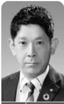
フィルムコミッションの戦略や計画への位置付けについて

【その他の質問】A1 デマンド交通(オンデマンド交通)による交通不便地域・公共交通空白地域への対応について