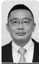
上柏屋・川上橋三光寺付近の冠水対策について

掃等の推奨を行い、降灰が生じた際には、窓やドアの締め切りなどの呼びかけを行っていく。要配慮者対策では、個別避難計画の策定を推進し、在宅避難を基本に介護事業者と連携した安否確認をする。なお、在宅避難が困難な方は本市が指定する避難所への避難や、そこでの生活も難しい方は福祉避難所への受け入れとし、移動支援は、防災関係機関等と協力していく。