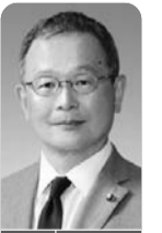
自治会の加入率低下と役員の手不足について

ている。また、令和6年度に自治会役員を対象に行った自治会活動に関するアンケート調査では、全地区に共通する課題として、役員選任、役員の高齢化、次世代育成が上位を占めている。自治会運営を持続していくためには、これまで自治会役員になりづらかった子育て中の方や現役世代の方が自治会活動に参加できる環境整備を行っていくとともに、自治会への理解を深める取り組みが必要であると考える。