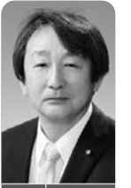
日向薬師・大山寺等の文化財の保護と防災について