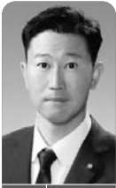
道の駅の必要性の検討過程について