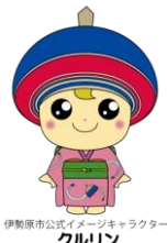
伊勢原市公式イメージキャラクター クルリン