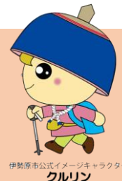
伊勢原市公式イメージキャラクター クルリン