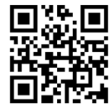
つうえんポータル

右記の二次元コードを読み込み、つうえんポータルにアクセスし、その画面にてお住まいの自治体を選択し、利用申請をしてください。