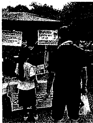
湘南ベルマーレホームタウンデー