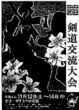
剣道交流大会・ねんりんフェスタ 2022 ポスター